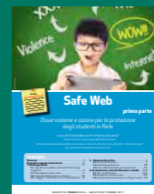
SAFE WEB PRIMA PARTE Agosto/settembre 2017